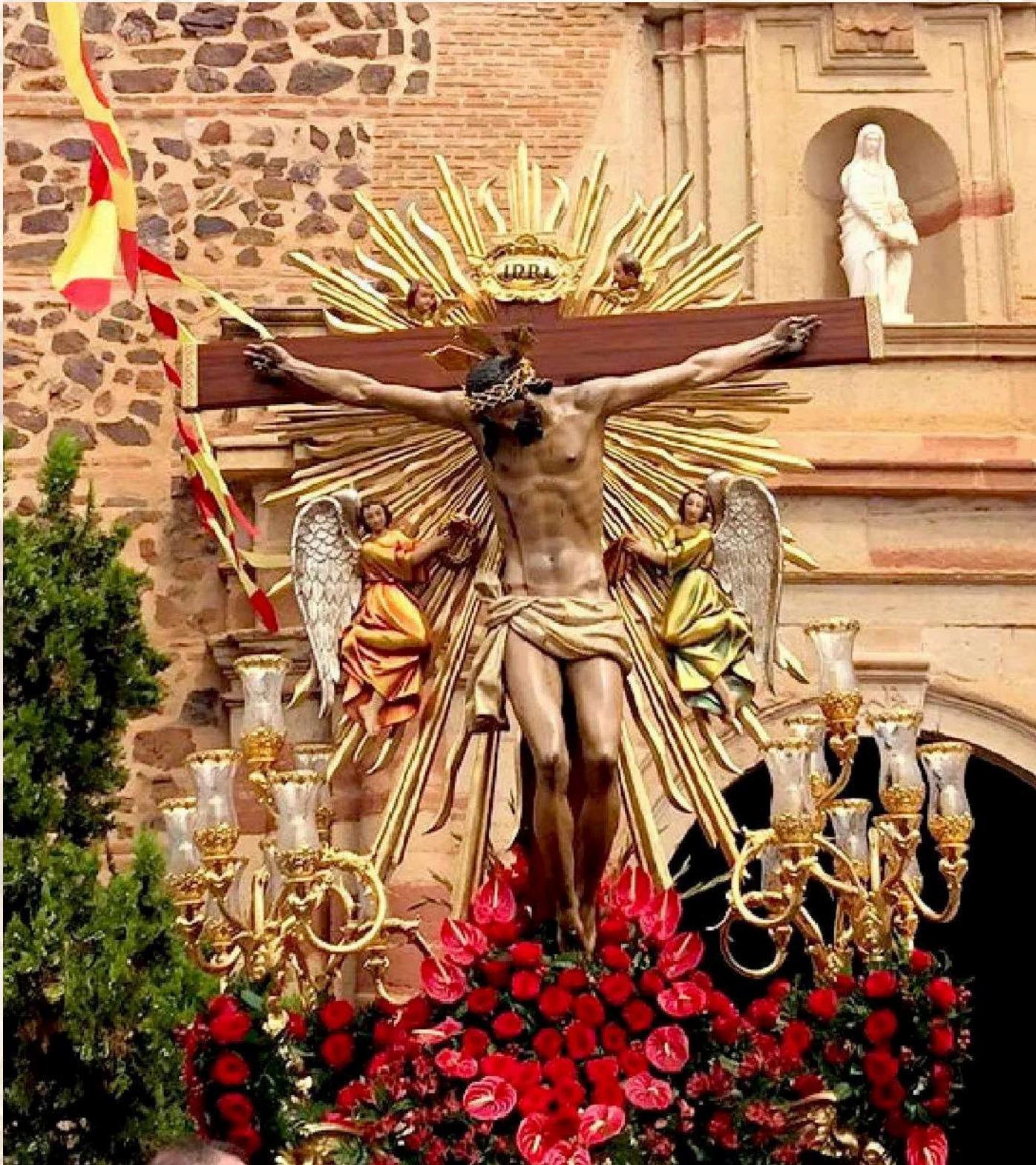
14 de Septiembre - Fiestas en Honor al Santísimo Cristo de la Misericordia